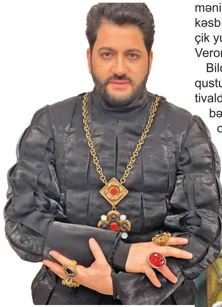
Yusif Eyvazov "Arena di Verona" opera festivalında

Rusiyada yaşayan tanınmış vokalçı soydaşımız, Azərbaycanın Xalq artisti Yusif Eyvazov İtaliyada "Arena di Verona" opera festivalında iştirak edəcək.