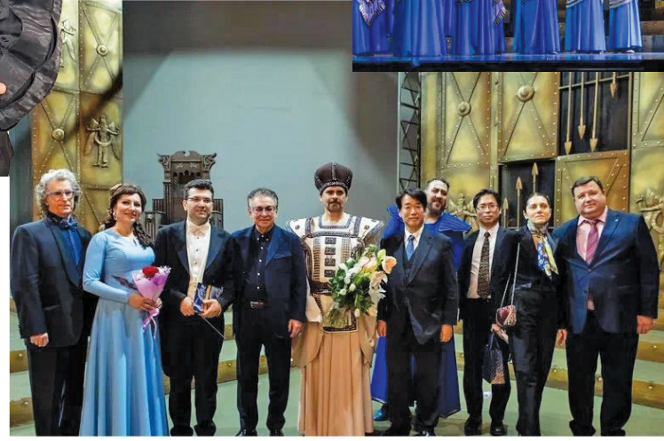
Şalyapın festivalının azərbaycanlı artistləri

Bu günlərdə isə Azərbaycanın incəsənət ustaları Kazan şəhərində (Tataristan Respublikası, Rusiya) keçirilən Şalyapın Beynəlxalq Opera Festivalına qatılabilir.