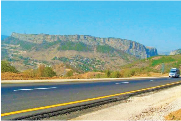
Əvvəlki səh. 1-də

2020-ci ilin mayında Şuşasızlığın növbəti ildönümü münasibətilə qələmə aldığımız pritiçada "Qarabağa getmək üçün gerek hamımız eyni rəngdə geyinək" deyə yazmışdıq. Bəli, təxminən beş ay sonra, sentyabrın 27-də xalq olaraq eyni rəngdə geyindik, Ali Baş Komandanın ətrafında dəmir yumruq kimi birləşib əsir Qarabağa, Şuşaya sarı yol aldıq. Bunu "yol getmək" adlandırdımaq o qədər doğru olmasa da, şanlı Ordumuz, əslində, canı-qanı ilə ele yol açdı. Bu, Everest zirvəsinə yol çəkməkdən daha çətin, həm də daha şərəfli idi!