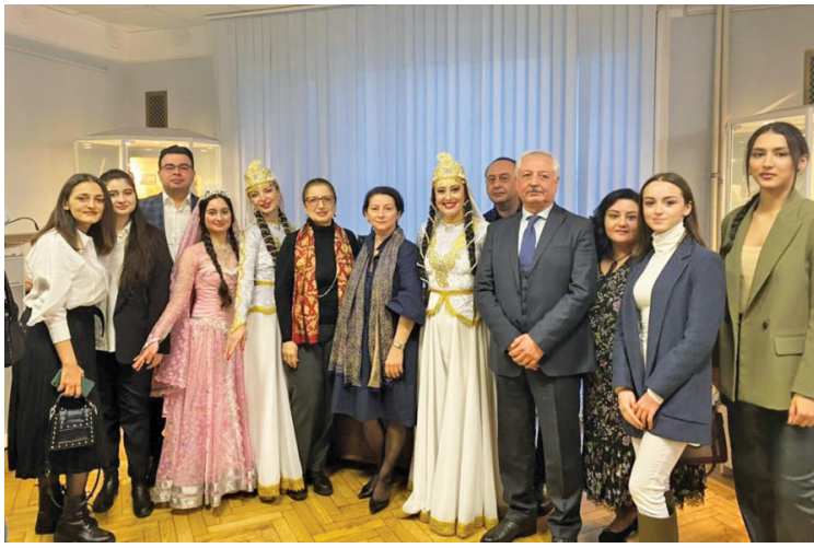
Bu qəbildən ilk tədbir kimi Moskvada Rusiya Dövlət Kitabxanası, MDB ölkələrinin milli diasporları, o cümlədən “Azərbaycan Konqresi”nin Moskva regional təşkilatının iştirakı ilə

Tematik il çərçivəsində MDB-yə üzv ölkələrdə xalq sənəti və folkloruna həsr olunan çoxsaylı layihə və tədbirlər planlaşdırılıb.