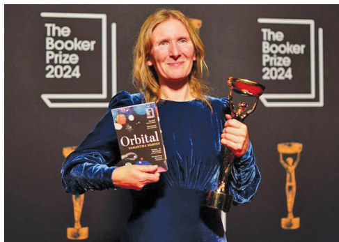
mövzulu kitabdır və eyni zamanda 136 səhifəlik ən qısa romandır.

Xatırladaq ki, Buker mükafatı 1968-ci ildə Buker-Makkonnel (Booker-McConnel) qida şirkətinin dəstəyi ilə təsis edildi. Mükafatın məbləği 50 min funt-sterlinqdir.